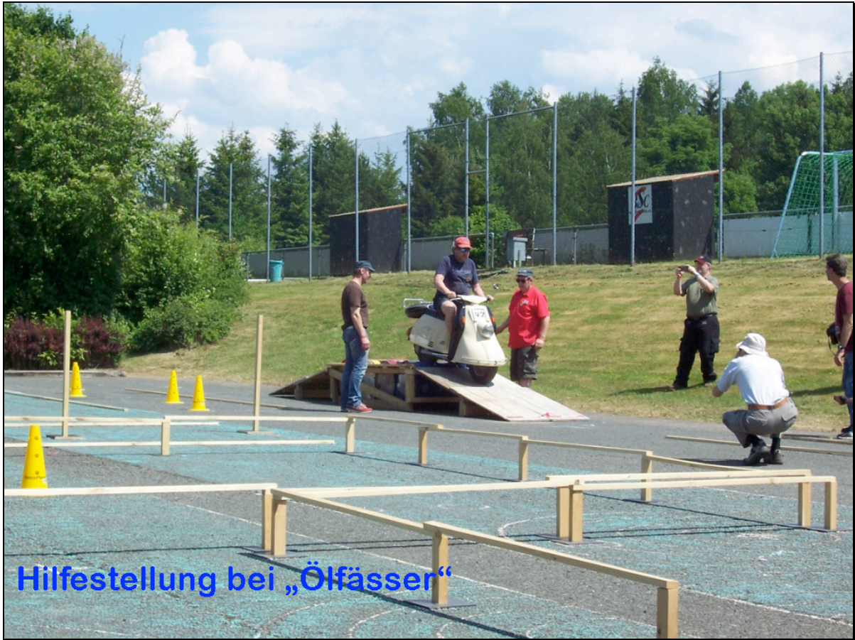
Hilfestellung bei „Ölfässer“