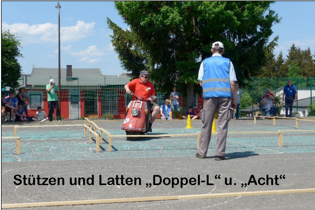
Stützen und Latten „Doppel-L“ u. „Acht“